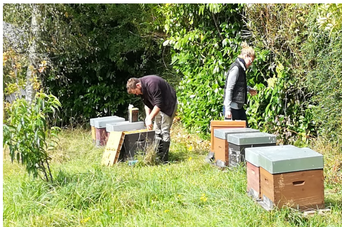
Balade botanique avec des ânes et découverte d'une miellerie septembre 2021

→ Participation à la réalisation d'un jardin